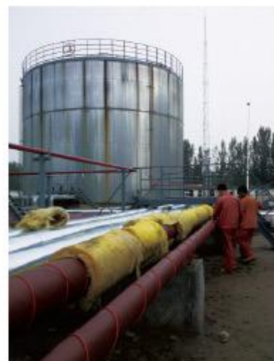
胜利油田东胜公司油库