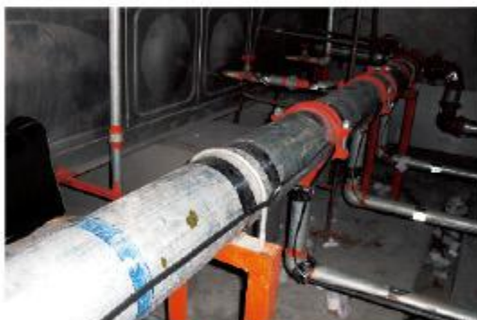
济南新生活家园屋顶消防管道及水箱