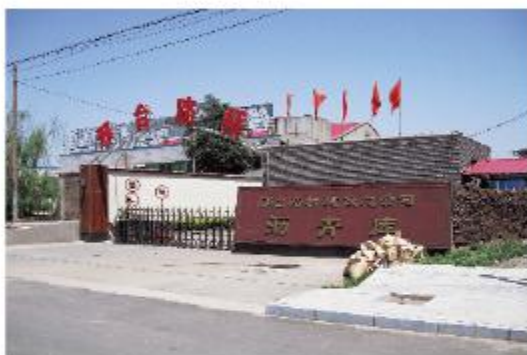
邢台路桥建设总公司