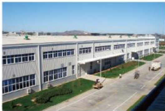
富士康（烟台）科技园