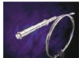
矿物绝缘加热电缆