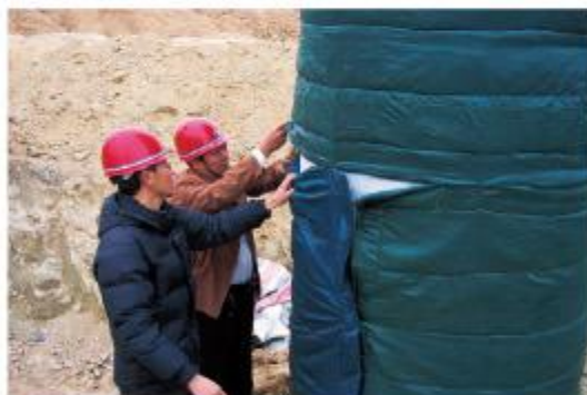
济宁立交桥混凝土冬季养护