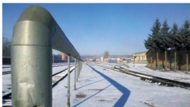
齐齐哈尔铁路局火车燃油输送管线