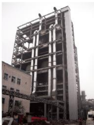
邯郸钢铁集团有限公司