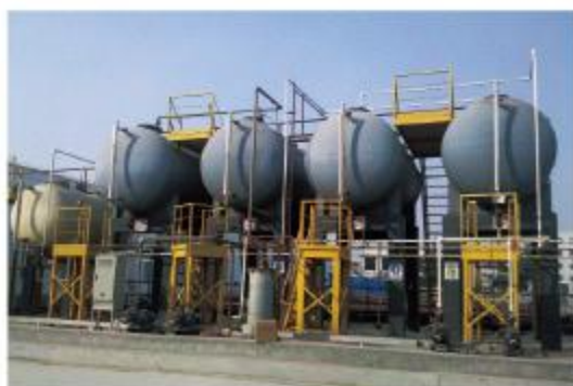
华能济南黄台发电有限公司