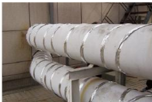
泰安某酒店消防及供水管道