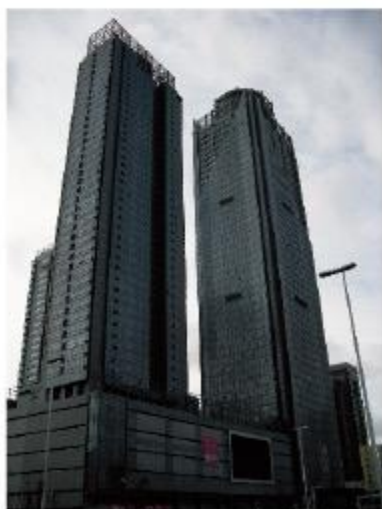
青岛开发区国际贸易中心大厦