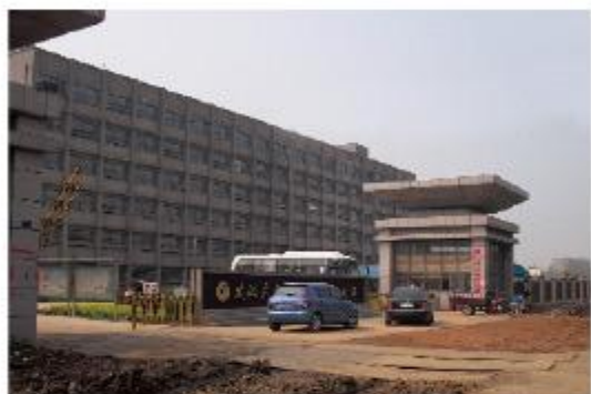
武汉东立光伏电子有限公司