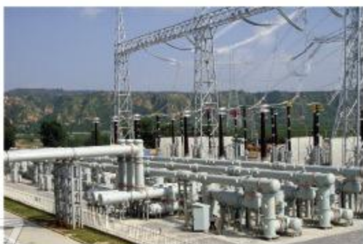
中电装备某高压电气有限公司