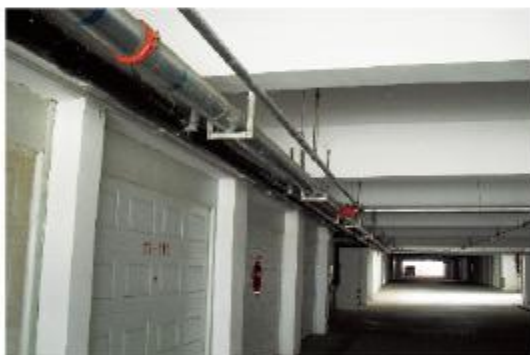
赤峰某小区地下车库消防管道