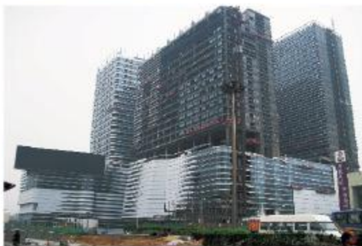
石家庄万象天成广场