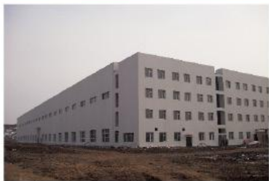
中国兵器装备集团新能源产业园