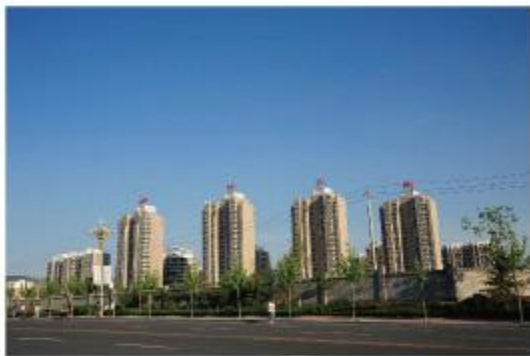
济南山水泉城项目消防管道