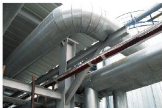
山东潍坊某化工有限公司